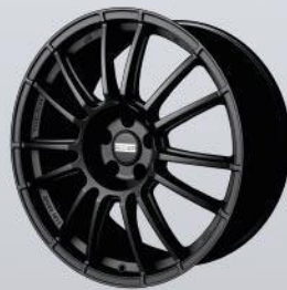
9RR superlight black matt / glossy