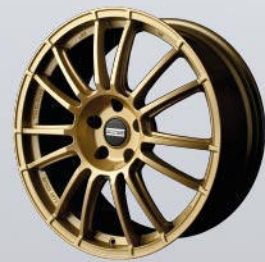
9RR superlight gold