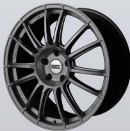
9RR superlight titanium matt / glossy